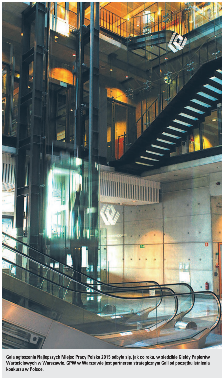
Gala ogłoszenia Najlepszych Miejsc Pracy Polska 2015 odbyła się, jak co roku, w siedzibie Giełdy Papierów Wartościowych w Warszawie. GPW w Warszawie jest partnerem strategicznym Gali od początku istnienia konkursu w Polsce.